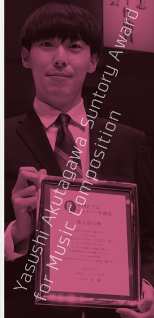
Yasushi Akutagawa Suntory Award for Music Composition