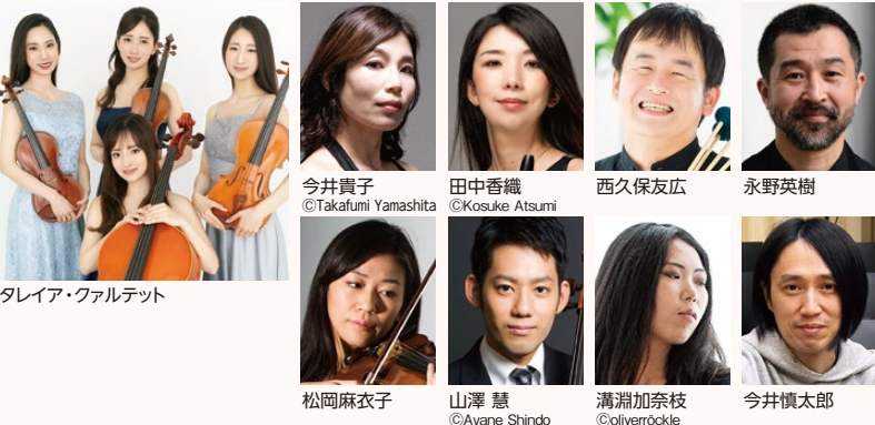
タレイア・カルテット

◆ 指定席 4,000円 / U25席 1,000円 Reserved Seating ¥4,000 / U25 ¥1,000