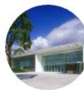
商品開発センター (日本)