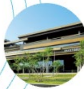
サントリーワールドリサーチセンター (日本)

私たちは、商品は研究開発と技術的な専門知識とともにあると考えています。新しい価値を生み出すための情熱を持ち、イノベーションを生み出すために、サントリー食品インターナショナルグループでは世界に10の研究開発拠点を設立しています。