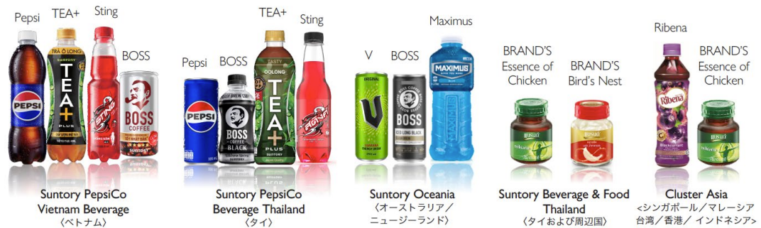
Suntory PepsiCo Vietnam Beverage (ベトナム)