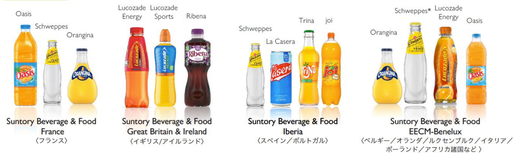
Suntory Beverage & Food France (フランス)