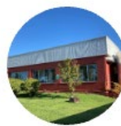
Tordera R&D Centre (スペイン)