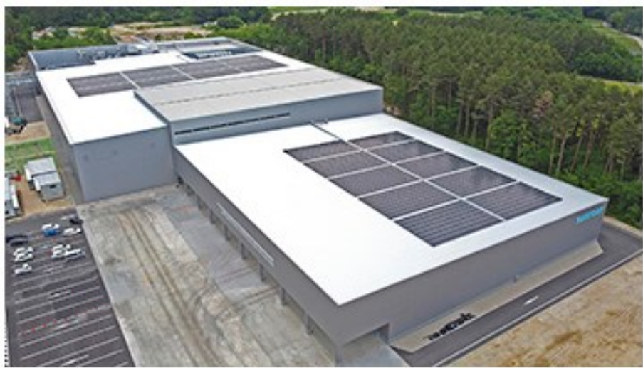
サントリー天然水 北アルプス信濃の森工場 (*2) (2021年5月稼働) “CO2排出量ゼロ工場”