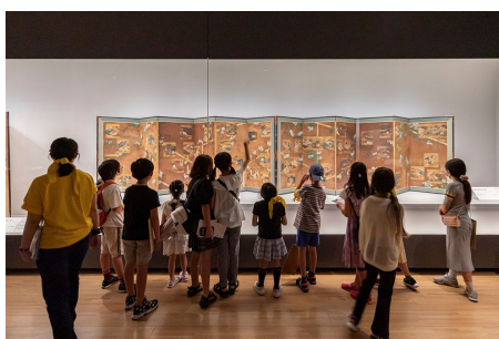
ツアー型プログラム(2023年の様子)