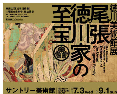
「徳川美術館展 尾張徳川家の至宝」

この高解像度画像は https://www.suntory.co.jp/news/article/sma0069.html に掲載しています。