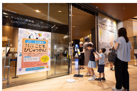
“こども専用”の特別イベント (2023年の様子)

難しいと思われがちな日本美術に親しみをもち、美術館に気軽に足を運ぶきっかけにしてほしい、という思いから生まれた「まるごといちにち こどもびじゅつかん!」。毎回展覧会にあわせて、学んで遊べるバラエティ豊かなプログラムを実施してきました。今年の夏も、みて、きいて、はなして、つくって……まるごといちにち、子どもたちが主役の美術館をお楽しみください。