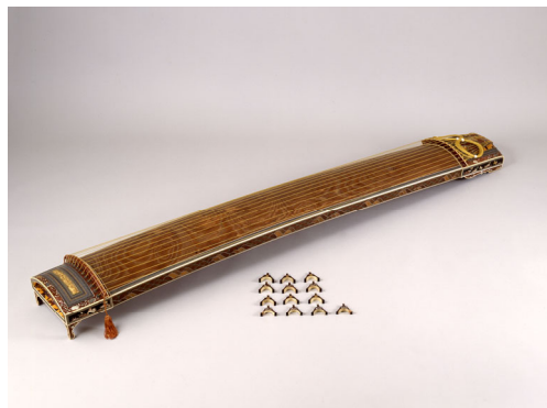
箏 銘 青海波 一面 桃山～江戸時代 17世紀 【通期展示】

武具をはじめとする公的な「表道具」に対して、大名自身やその家族が「奥」とよばれる私的な生活の場で使用した道具、また教養を高め、趣味や遊びに用いた道具は「奥道具」と言われます。大名自身をはじめ武家の者は、和歌を詠み、絵・音楽や文学に親しむことを一つの価値観・人生観とし、数多くの作品や道具類が大家に所蔵されました。