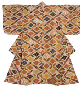
紅地雷文・四ツ花菱文厚板 一領 江戸時代 17世紀 【展示期間：7/31～9/1】