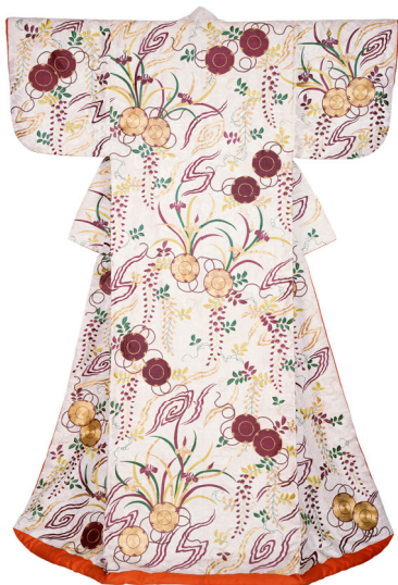
白綸子地鼓に藤・杜若文打掛 一領 江戸時代 19世紀 【展示期間：7/3～7/29】