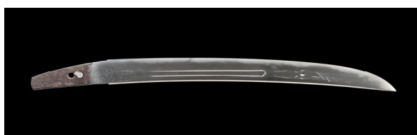
重要文化財 脇指 無銘 貞宗 名物 物吉貞宗 一振 南北朝時代 14世紀 【通期展示】