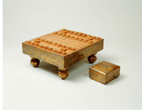
国宝 胡蝶蒔絵将棋盤・駒箱 一揃 江戸時代 寛永16年(1639) 【展示期間：7/31～9/1】

寛永16年(1639)三代将軍徳川家光の長女千代姫(1637～98)が数え3歳で尾張徳川家二代光友に嫁いだ際の婚礼調度は、「初音の調度」の名で親しまれています。『源氏物語』第二十三帖「初音」に題材をとった「初音蒔絵調度」47件、同じく第二十四帖「胡蝶」に基づく「胡蝶蒔絵調度」10件、その他の意匠の蒔絵調度や染織品、刀剣など13件の計70件で、平成8年(1996)に一括して国宝に指定されました。このうち「初音蒔絵調度」および「胡蝶蒔絵調度」などの蒔絵調度は、室町時代から江戸時代に至るまで、時の政権に蒔絵師として仕えた幸阿弥家十代長重(1599～1651)が手がけました。葦手文字を散らした文学的意匠もさることながら、総体梨子地仕上げで、高度な技術を要する高蒔絵や研出蒔絵に平蒔絵、切金・付描などさまざまな蒔絵技法が駆使されており、漆工史上、最高峰の蒔絵技術を示す名品として高く評価されています。