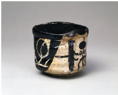
重要文化財 織部筒茶碗 銘 冬枯 一口 江戸時代 17世紀 【通期展示】