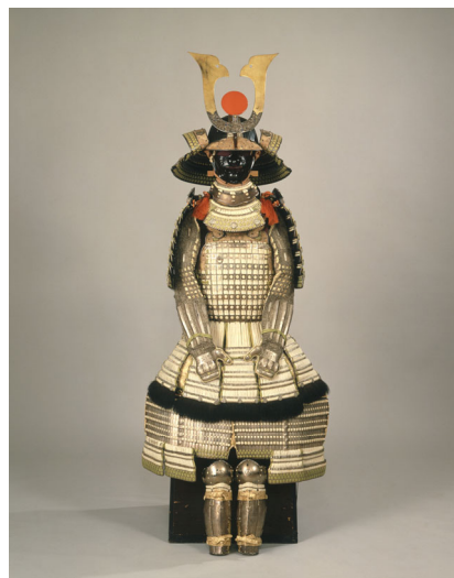
銀溜白糸威具足 一領 江戸時代 17世紀 【通期展示】

尾張徳川家は徳川家康（1542～1616）の九男・ よしなお 義直（1600～50）を初代とする御三家筆頭の大名家です。慶長5年（1600）9月、かの天下分け目の大戦・関ヶ原合戦から約2カ月後、義直は大坂城で誕生しました。はじめ甲斐国を与えられましたが、慶長12年に兄で家康四男の ただよし 松平忠吉（1580～1607）がこの世を去ると、その跡を継ぎ清須城主となりました。同19年には尾張徳川家代々の居城となる名古屋城を完成させ、尾張国一国・美濃国・三河国の一部・信濃国の木曾山など、六十一万九千五百石に及ぶ領国を有しました。