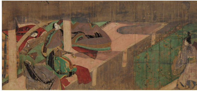
国宝 源氏物語絵巻 橋姫 一巻 平安時代 12世紀 【展示期間：7/31～8/15】

11世紀初頭に紫式部が著した『源氏物語』を絵画化した現存最古の作例で、12世紀前半、院政期の宮廷を中心に製作されたとみられます。数多く描かれた源氏絵のなかでも、物語への深い理解と共感に基づき、平安貴族の生活様式や美意識をよく伝えており、ひとときわ高い格調と説得力をもって、観る者を魅了します。