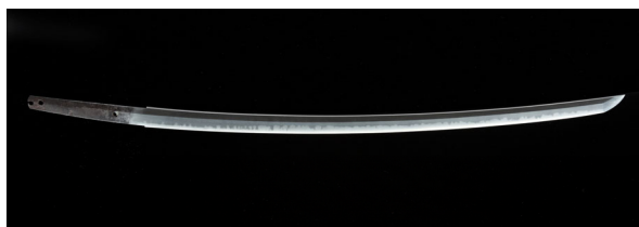
国宝 太刀 銘 長光 名物 津田遠江長光 一振 鎌倉時代 13世紀 【通期展示】