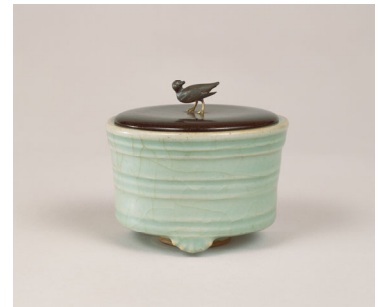
青磁香炉 銘 千鳥 大名物 一口 南宋時代 13世紀 【展示期間：7/3～7/29】

政治を担い文化を庇護する立場にあった大名には、礼法や教養が求められました。特に、茶・能・香は、儀礼や外交といった公的な場で行われたため、必ず習得すべき芸道でした。