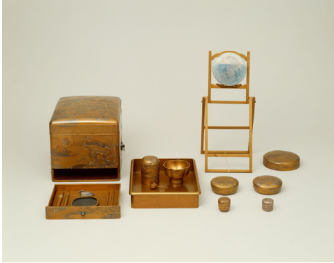
国宝 初音蒔絵旅眉作箱 一具 江戸時代 寛永16年(1639) 【展示期間：7/3～7/29】