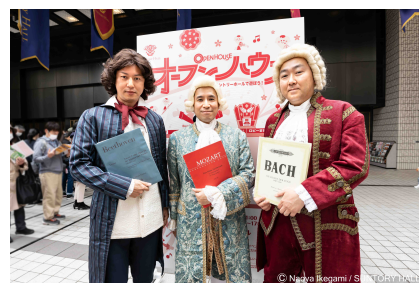
2023年オープンハウスより