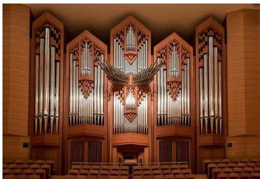
サントリーホールのオルガン