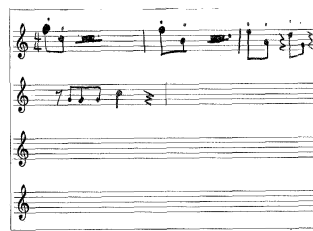
⑤ 森英美理 (もり・えみり) 小学3年生