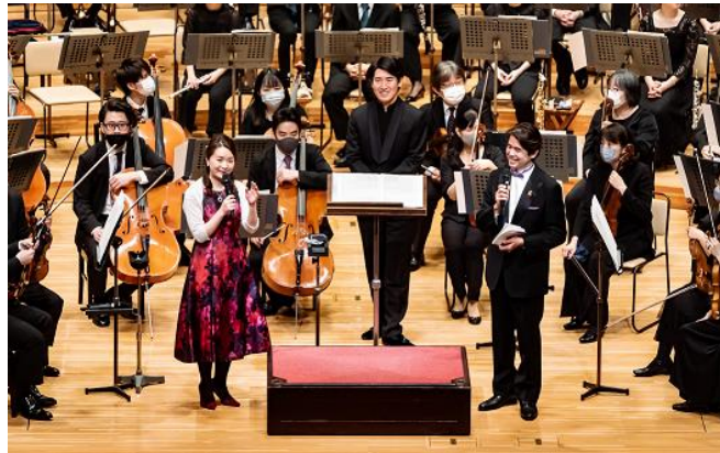
第1回目の「新曲チャレンジ・プロジェクト」採用作品世界初演時。