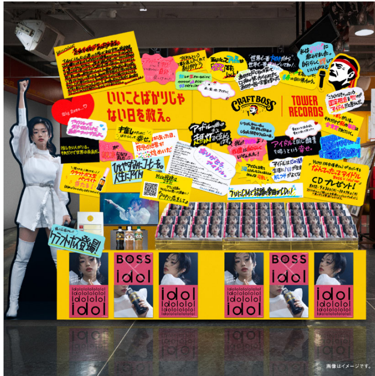
クラフトボス×タワレコ 特設コラボブース