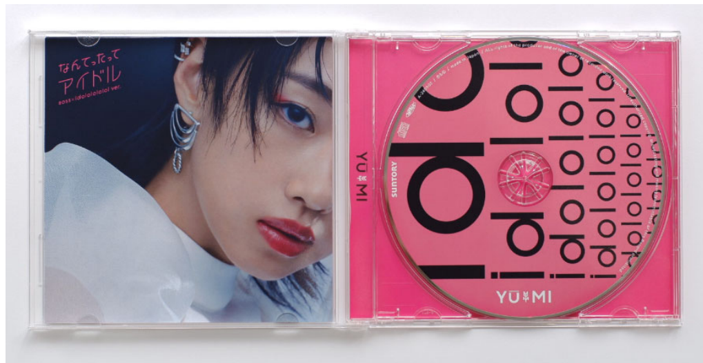
「なつてたってアイドル BOSS×idol ver.」オリジナルCD 内面