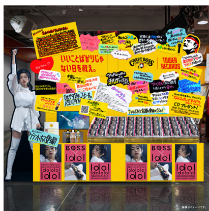
クラフトボス×タワーレコ 特設コラボブース