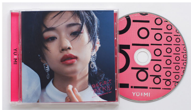
「なんてったってアイドル BOSS×idol ver.」オリジナルCD