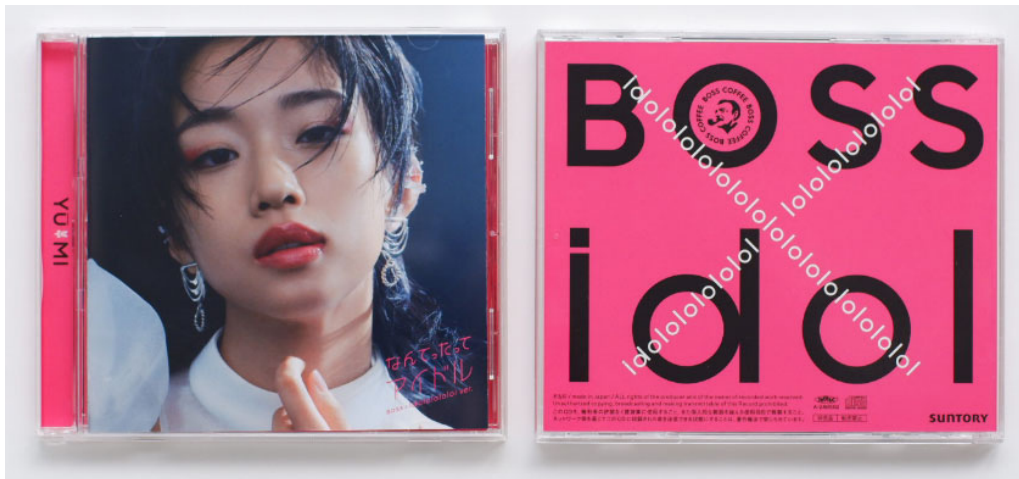
「なつてたってアイドル BOSS×idol ver.」オリジナルCD 外面(表裏)