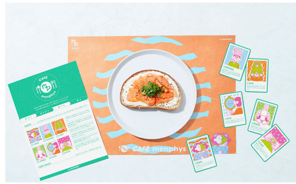
カルテシート・オープンサンド・カード

この高解像度画像は https://www.suntory.co.jp/softdrink/news/ に掲載しています。