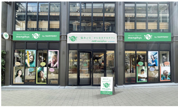
カフェ外観イメージ