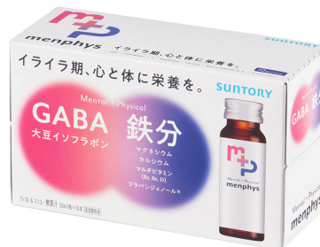
「menphys GABA&大豆イソフラボン&鉄分」