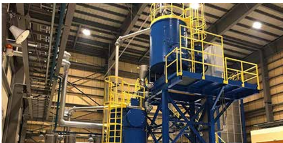
現在稼働中のFtoP成型機第一ライン