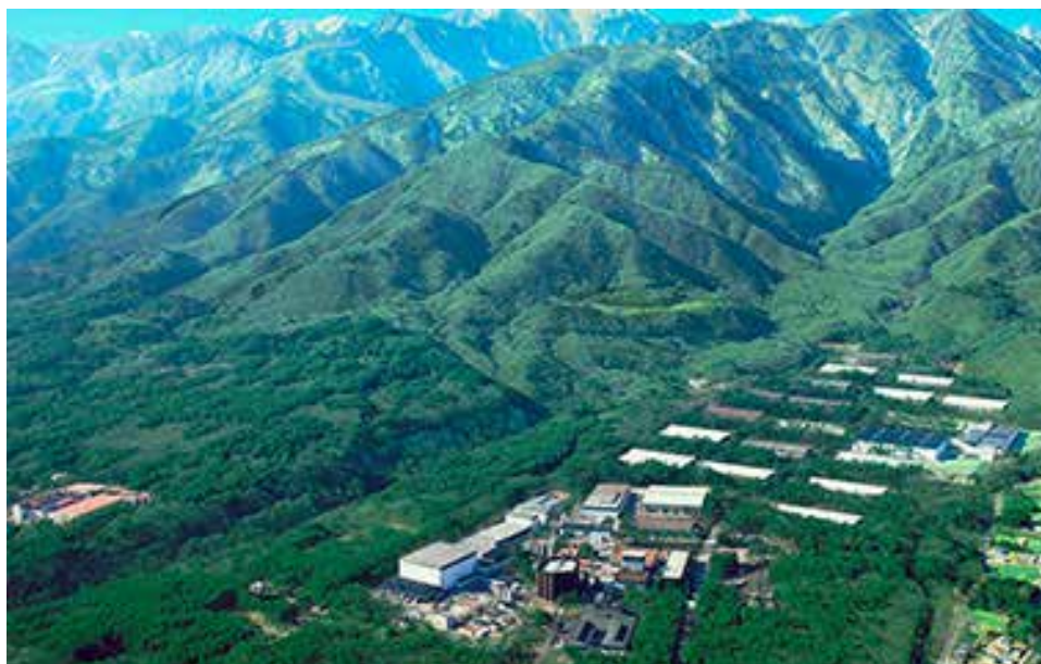
サントリー天然水 南アルプス白州工場

そして、この「天然水の森」活動の知見を活かし、グローバルでも水資源涵養活動など水のサステナビリティに取り組んでいます。