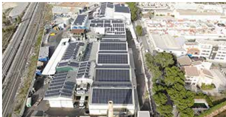
スペインのカルカヘンテ工場の太陽光パネル

サントリーグループの工場では、積極的に最新の省エネルギー技術を導入しています。例えば利根川ビール工場では、自家発電で生じた熱を回収して熱源として使用するコジェネレーション（熱電併給）システムで得た電力を、別の工場で使用する「電力託送」を行っています。メキシコのテキーラ工場では蒸溜工程の熱回収率を向上させる「貫流ボイラー」を採用しています。また、スペインのカルカヘンテ工場では発電能力約737kW、天然水南アルプス白州工場では、約490kWの太陽光パネルを設置するなど再生可能エネルギーの活用を推進するほか、GHG排出量の少ない都市ガスやLNG（液化天然ガス）、バイオマスといった燃料への転換など、多角的にGHG削減に取り組んでいます。