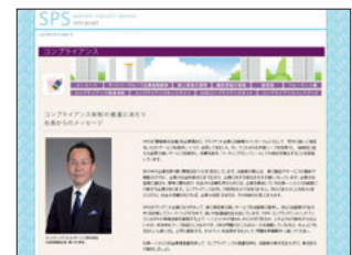
イントラネット上でコンプライアンスに関する啓発活動を実施

サービス・マネジメント企業としてお客様の期待に応えるため、サントリーパブリシティサービス(株)では、従業員へのコンプライアンスの周知・啓発を推進しています。研修やe-ラーニング、ハンドブックや社内イントラネットを通じた取り組みだけでなく、各拠点に「コンプライアンス・リーダー」を配置し、各職場での取り組みも行っています。