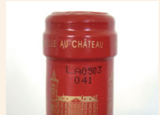
キャップシールに印字されたコード番号

シャトー ラグランジュでは、すべてのびんのキャップシールにコード番号をつけています。原料に加え、ワインに使用されるコルク・びん・ラベル・ケースなどすべての資材を検査し、その結果をコード番号で記録することで、ワイン1本1本の履歴を一貫してトレースすることができます。