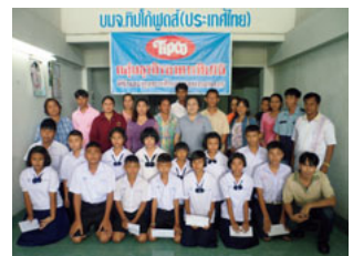
工場近隣の幼稚園・小学校の子どもへ奨学金を贈呈

ティプコグループでは、経済的な問題をかかえる子どもの教育を支援する奨学金制度を設けており、これまでに246名に対し奨学金を提供しました。また、工場近隣にあるバーンブン学校に対しては、教職員の雇用を支援する目的で寄付を行っています。