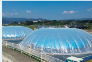
ドーム型の植物工場「グランパファーム陸前高田」

日本サブウェイ(株)では、野菜の安定調達を目的としたさまざまな試みを行っています。その1つが、経済産業省の復興支援事業の一環として岩手県に建てられた植物工場「グランパファーム陸前高田」での野菜づくりです。この植物工場ではできる限り自然の力を活用することをコンセプトに、農薬の代わりに天敵の虫を使った害虫駆除などを行っています。「グランパファーム陸前高田」で栽培されたレタスは、東北地区の店舗の一部で使用されています。