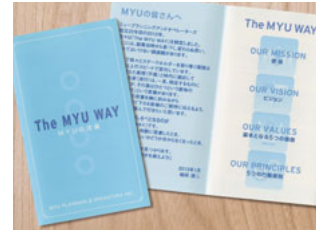
全従業員が持つ行動指針「The MYU WAY」

「The MYU WAY」の浸透を図るため、携行可能な冊子を作成し、全従業員に配布しました。