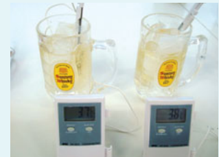
ハイボール用ジョッキの液温度変化テスト

(株)サントリーショッピングクラブでは、企画・開発から、原材料の選定・調達・製造・販売に至るすべてのプロセスで、徹底した品質の確保・向上に取り組んでいます。新規商材においては、市場ニーズの分析から調達先開拓、試作モデルの使用検証まで一貫して担当し、常にお客様の立場に立った企画・開発に取り組んでいます。