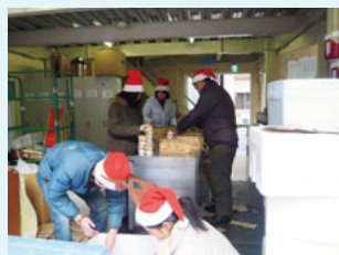
クリスマスにアイスクリームを届ける従業員の様子

※製造・流通過程などが出る、安全上は問題がないにも関わらず、廃棄される食品の寄付を受け、社会福祉施設などに無償で提供する活動