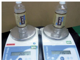
軽量化を実現したペットボトル

2012年4月より、製造業の環境負荷低減促進を目的とした認証取得を目指して、活動を開始しました。工場での省エネ・省資源の活動・データ報告を行うことで、認証の取得が可能になります。具体的な取り組みとして、三得利(上海)食品有限公司では、ペットボトルの軽量化を積極的に推進しています。