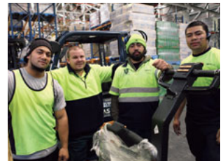
オークランド物流センターに勤務する従業員

フルコア・グループでは企業理念「value you(一人ひとりを尊重しながら)」に基づき、安全衛生を従業員一人ひとりが取り組むべき最重要項目の1つに位置づけています。安全衛生を数値化して管理し、安全運営チームが定期的に改善すべき課題を検討しています。また、外部機関とも積極的に連携し、国の基準を上回るように努めています。