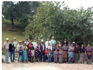
グアテマラのコーヒー農家の方たち

サントリー食品インターナショナル(株)のコーヒー「BOSS」の原料豆は、多くの生産者の方々に支えられ、世界各地から供給されています。サンカフェ(株)では、2005年から毎年、主要調達先である中米グアテマラに従業員を派遣し、生産者の方との交流や、栽培方法などを学ぶ研修を行ってきました。さらに、2012年からは、零細コーヒー農家の生活改善や、医療サポートを通じた持続的なコーヒー生産を支援する活動を展開。有機農業の普及、診療所の開設、移動病院の運営など、長期的な生活環境改善を目指す活動を支援しています。