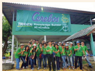
ボランティアに参加したシンガポール本社とタイオフィスの従業員

また、修復と同時に行われた施設拡張の手伝い、壁の塗装、壊れた学校家具の修理などを通じ、子どもたちの学習環境の再整備を支援しました。