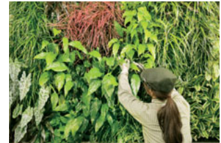
グリーン・カルテに基づき保守・点検するグリーン・スタイリスト

サントリーミドリエ(株)は、土に代わる新素材「パフカル」をベースに、屋上・壁面・室内緑化に最適な緑化プランをご提案しています。お客様ごとにグリーン・カルテを作成し、メンテナンスのプロであるグリーン・スタイリストが定期的に植物の健康状態をチェックして、生育環境の保守・点検を行っています。グリーン・スタイリストの作業記録は毎月報告され、品質・サービスの向上や資材の改良に結びついています。