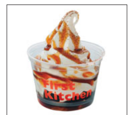
改良されたカップ

ファーストキッチン(株)は、「環境にやさしいファーストキッチン」の実現に向け、環境経営に積極的に取り組んでいます。2012年は、デザートプラカップをポリプロピレンカップに変更することで約1トン、ポリ手提げ袋を軽量化・薄型化に規格変更することで約2.7トンの樹脂使用量を削減しました。