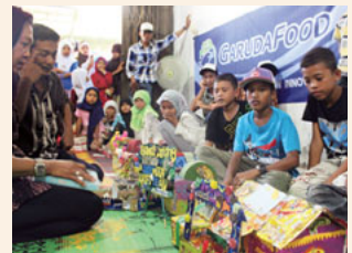
約200名の子どもたちがイベントに参加

サントリーガルーダ・ビバレッジでは、容器やラベルなどの廃棄物を使って創作活動を行っています。小学校や地域社会と連携し、それぞれの想像力と創造性を活かしながら、回収された廃棄物を、バッグや植木鉢、傘などの品物に再利用する活動を実施しています。