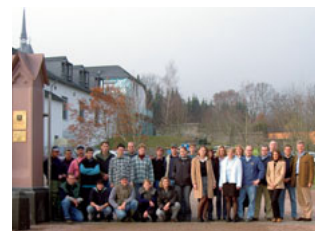
ロバート ヴァイル醸造所に勤務する従業員

ロバート ヴァイル醸造所は、従業員30名の小規模なワイナリーですが、ノウハウを蓄積した従業員に長期的に勤務してもらうために、満足度の高い労働環境を整備しています。産休・育休制度に加えて、約2カ月間の在宅勤務制度を設けるなど、仕事と家庭の両立を重視する、従業員の多様な働き方を支援しています。