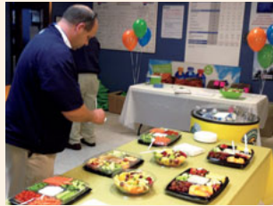
「金曜日は新鮮フルーツの日」の様子

水曜日の昼休みには、ストレッチやウォーキングなどの運動を行ったり、「金曜日は新鮮フルーツの日」を設け、健康的な朝食や軽食を提供するなど、従業員の健康維持・増進を図っています。