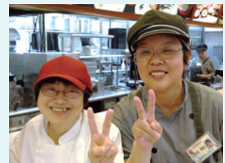
ダイナック三木サービスエリア店(兵庫県)にて5年間勤務をしている従業員

現在は雇用率を上げるだけでなく、地域の支援機関・ハローワーク・支援者・保護者と連携し、障がい者一人ひとりの働きがいや生きがいとなるように、個々にきめ細やかな対応を心がけて、活動を継続しています。