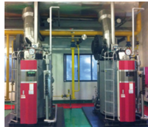
メタンガスボイラー

サントリービール(上海)工場では、2011年に嫌気性排水処理時に発生するメタンガスを再利用する専用ボイラーを導入しました。メタンガスをLNG(液化天然ガス)の代替として活用することで、年間約50万Nm 3 のLNGを削減できました。これにより年間約850トンのCO 2 排出量を削減しました。