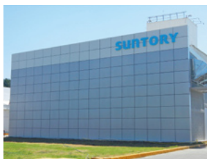
新ユーティリティ棟

その成果として、老朽化した水管ボイラーを最新式小型貫流ボイラーに更新し、燃料使用の効率化を図るとともにNO x 排出量を削減しました。さらに2011年には、高効率スクリーコンプレッサーを導入して電力使用量の低減を図るなど、環境負荷低減に向けた活動に力を注いでいます。