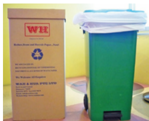
シンガポールオフィスのリサイクルボックス

シンガポールオフィスでは、従業員への環境教育と、現在の環境管理の統合的アプローチを拡大することを目標に、廃棄物削減とリサイクルのプログラムを導入しました。このプログラムはすでに本社で成功を収め、リサイクル率が国平均の57%を上回る60%を達成しました。今後は、この取り組みをすべての地域に展開する計画です。また、省電力などの環境活動も順次導入していきます。