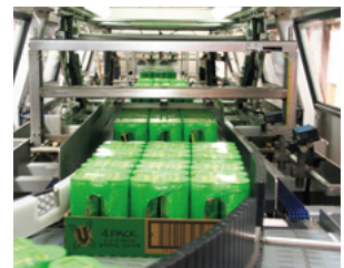
エナジードリンク「V」のライン

フルコアグループは、政府の支援によるエネルギー監査を2009年に受けました。この監査での提言に基づき、エネルギー効率改善の取り組みを推進してきました。また、2009年にオークランド大学工学部と共同で、水や液体廃棄物の調査を行いました。この調査結果に基づき、フルコアグループの継続的な改善計画の1つとして生産ラインの効率化に取り組んでいます。