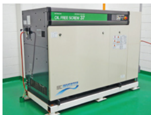
高効率スクリーコンプレッサー