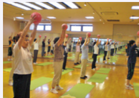
介護予防運動の指導

(株)ティップネスでは、関東・関西を中心に介護予防事業を展開しています。2011年は、行政や民間事業など117教室にて介護予防運動の指導を行い、計3,550名の高齢者の方に参加していただきました。一度参加された高齢者の方は、ほぼ100%継続されており年々広がりを見せています。