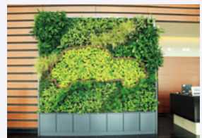
トヨタ自動車(株)名古屋オフィスに設置した「花のかべ」

2012年4月、サントリーミドリエ(株)は上海市にトヨタ自動車(株)との合弁会社「トヨタサントリーミドリエ(上海)園芸(有)」を設立し、中国での都市緑化事業を協働して行っていくことを発表しました。当社は、すでに中国で緑化事業を展開していますが、トヨタ自動車(株)が開発した環境緑化植物と当社独自の素材「パフカル」を組み合わせることで緑のある街づくりを加速し、ヒートアイランド現象の抑制に貢献できると考えています。