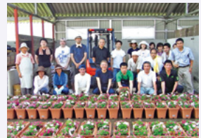
岩手県陸前高田市を訪問した社員

2011年5月、「MUFG・ユネスコ協会 東日本大震災復興育英基金」が運営する「花壇再生プログラム」に花苗を提供したほか、宮城県の小学校や、被災地のグリーンアドバイザーの活動用に花苗を提供しました。また、7月には社員が岩手県陸前高田市を訪問し、オリジナル商品「ミリオンベル」「サンビーナス」をプランターに植え、仮設住宅の方々にお届けしました。